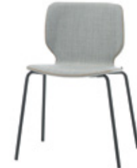
Four leg chair with upholstered shell Silla cuatro patas con carcasa tapizada Chaise 4 pieds coque tapissé